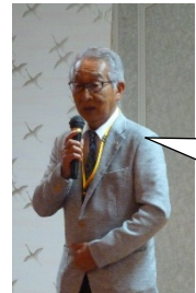
山中RC 谷口副会長 中締め