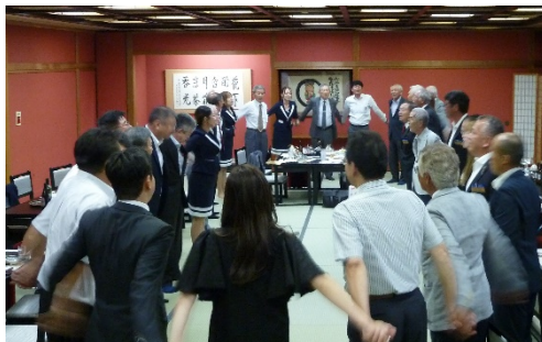
道木会長エレクト 中締め