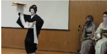
～御祝儀の舞～ 山中芸妓連の皆様