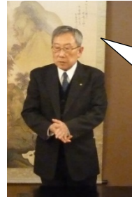
竹吉副会長 閉会挨拶