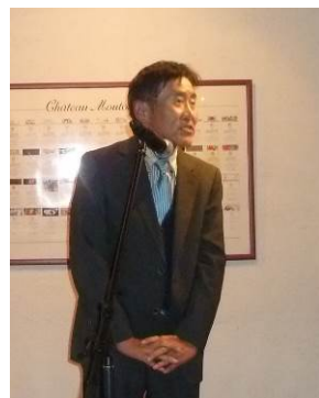
水崎副会長の閉会の言葉