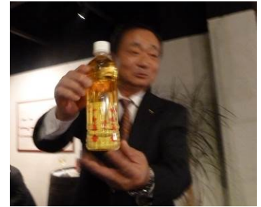
ペットボトルの中にトランプが・・・。