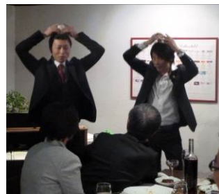
頭の上のコップの水は