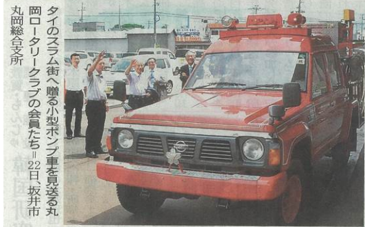
丸岡総合支所 タイのスラム街へ贈る小型ポンプ車を見送る丸岡ロータリークラブの会員たち。22日、坂井市