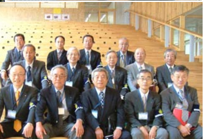
表現の舞台 (多目的ホール)