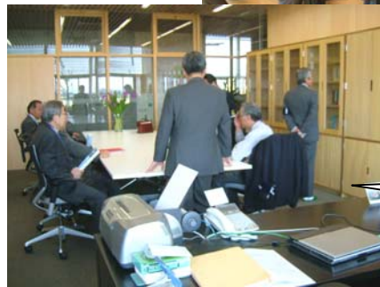
ガラス張りの校長室