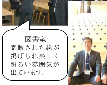
図書室 寄贈された絵が掲げられ楽しく明るい雰囲気が出ています。