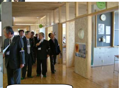
生徒の個人ロッカー