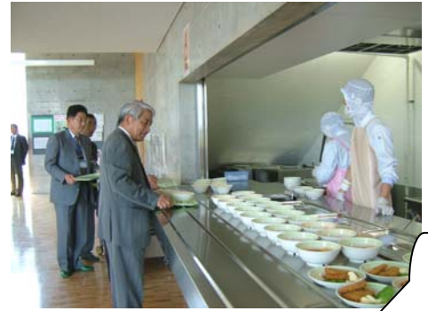
生徒と同じ給食をランチルームでいただきました。