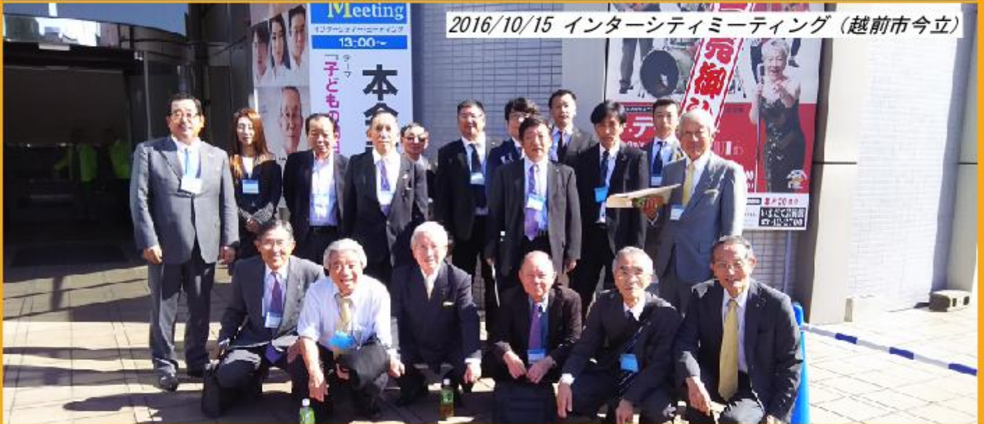
2016/10/15 インターシティミーティング (越前市今立)