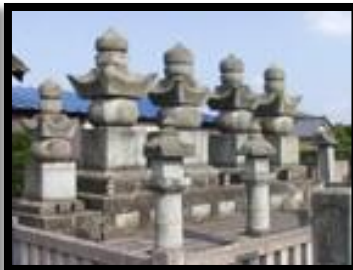
本多家の墓所(本光院)

三国町梶の海岸。 幕末の1852年に外国艦渡来 に備えて築いた丸岡藩の砲 台には今でも、土塁と5カ所 に砲眼と呼ばれる大砲を備 える切り通しが残されてい ます。