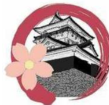
「丸岡城天守を国宝にする市民の会」