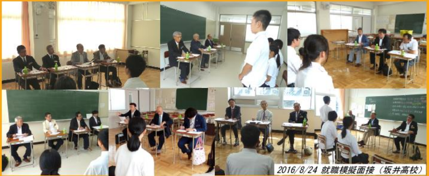
2016/8/24 就職模擬面接（坂井高校）